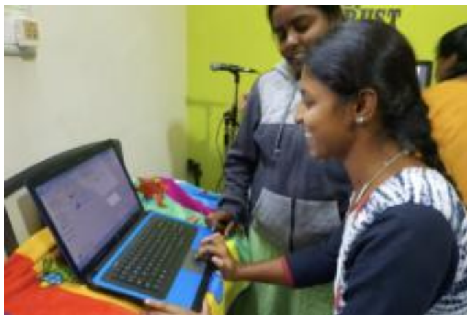
Schulung am Computer

Zusätzlich weisen wir darauf hin, dass alle Kolpingsfamilien gerne unseren Fachausschuss für einen inhaltlichen Abend zum Indienprojekt anfragen können. Spendenkonto: OLB Vechta BIC: OLBODEH2XXX, IBAN: DE63 2802 0050 4008 0327 00