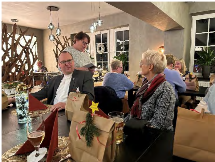
Dankesworte der Landesvorsitzenden bei der gemeinsamen Adventsfeier 2024 des Landesvorstandes, des Jugendvorstandes, der Bezirksvertreter & der hauptamtlichen Mitarbeiter*innen!

Vieles was bei KOLPING geschieht, ist ohne das gemeinsame Engagement zahlreicher ehrenamtlicher Kolpingschwestern und -brüder nicht möglich. Das gilt sowohl in den Kolpingsfamilien als auch im Landesvorstand, dem Vorstand der Kolpingjugend, den Landesfachausschüssen, den Teams und den Kolpingeinrichtungen. Dafür ein herzliches Dankeschön . Ohne die hauptamtliche Unterstützung könnten Ehrenamtliche nur halb so viel leisten. Deshalb gilt mein Dank ebenso allen hauptamtlich Mitarbeitenden, besonders auch den Damen im Büro.