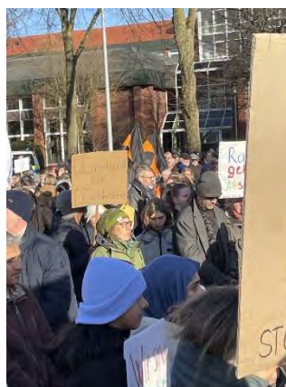
Bilder der Kundgebungen in Vechta & Cloppenburg