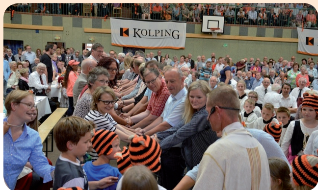
Das Kolpingwerk Land Oldenburg mit seinen Kolpingsfamilien - eine lebendige Geschichte mit Zukunft!

Das Kolpingwerk Land Oldenburg will Bewusstsein schaffen und fördern - für ein verantwortliches Leben und solidarisches Handeln.